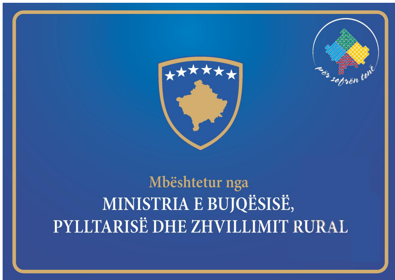
Shtojca 16: Logo -Promovimi